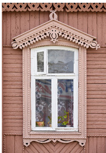
Рис. 2. Рязанский наличник