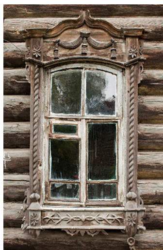
Рис. 4. Томский наличник