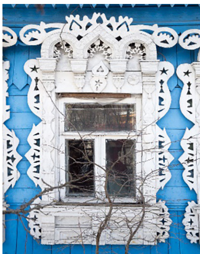
Рис. 1. Гжельский наличник, Московская область