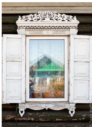
Рис. 5. Омский наличник

различных стилей и традиций. Омск, будучи более молодым городом, мог заимствовать элементы из других регионов, что также отразилось на дизайне наличников); экономические факторы (Томск, как центр образования и культуры, мог привлекать мастеров и ремесленников, что способствовало разнообразию и сложности резьбы. Омск, являясь важным транспортным узлом, мог заимствовать идеи и стили из других регионов, что также отразилось на оформлении наличников).