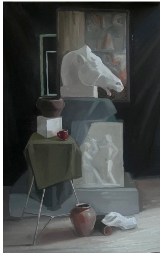
Рис. 4. Итоговая работа автора