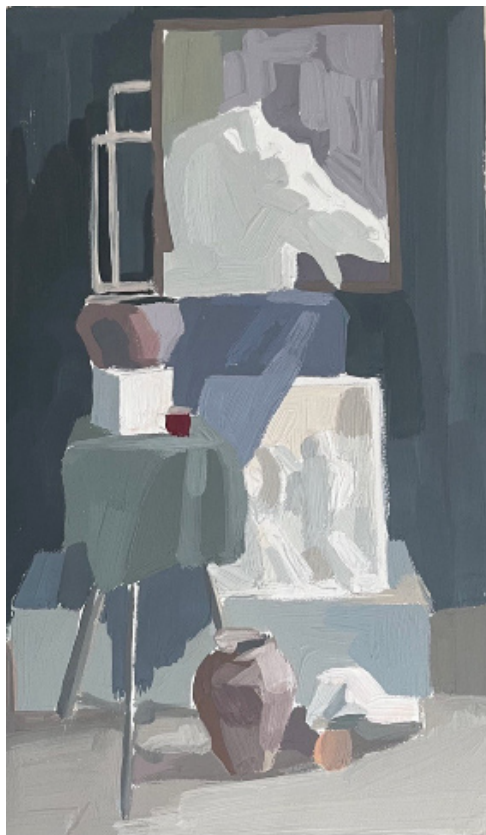
Рис. 3. Проработка цветовых и тоновых отношений. Работа автора