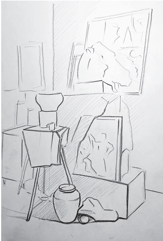
Рис. 1. Эскиз (вариант 1). Работа автора