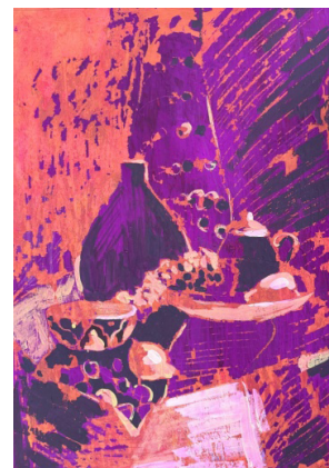
Рис. 3. Прием стилизации с применением силуэтного решения. Работа автора

– усложнение формы и активное заполнение изображения декоративными элементами [3, с. 75].