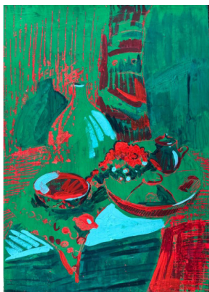
Рис. 1. Прием «Плоскостной» стилизации. Работа автора