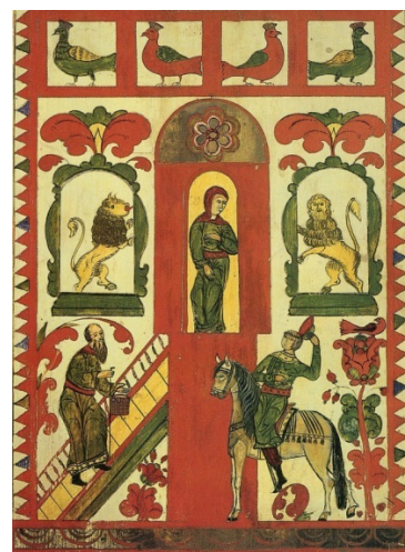
Рис. 3. Фрагмент росписи на прялке «Сватовство», XX в. [5]

звезд (рис. 3). В центральной части размещен отличительный элемент северной деревянной архитектуры — парадный вход на высоком столбе. На представленной иллюстрации изображен богато украшенный дом невесты. Описана сцена сватовства. К невесте по ступеням вверх поднимается старик, а внизу ожидает жених на коне. На каждом персонаже видны древнерусские костюмы, соответствующие времени [4, с. 117].