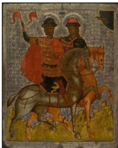
Рис. 1. Борис и Глеб на конях, ок. 1377 г. [2]