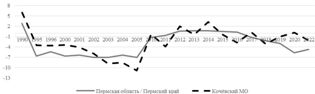
Рис. 1. Общий коэффициент естественного прироста, ‰