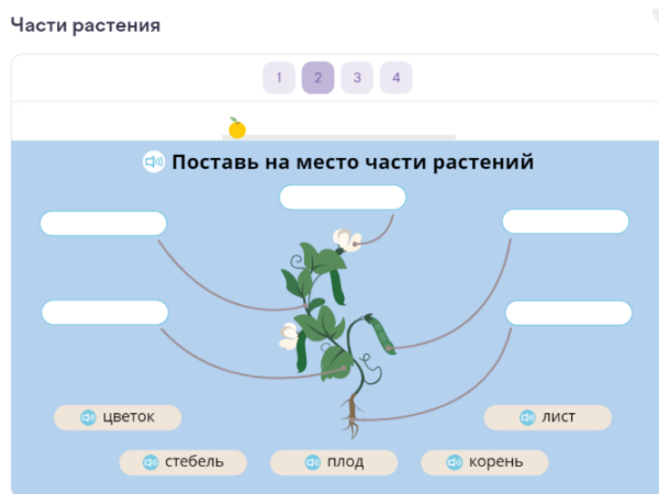
Рис. 1. Пример интерактивного задания платформы

Демонстрацию материала логично применять для многих учебных задач, однако преподаватель не ограничен в использовании платформы по времени или информации. Все материалы на платформе «Учи.ру» представлены в интересной и понятной для младших школьников форме. Многообразие заданий в различной форме помогает закреплять изученный материал. Платформа предоставляет такие виды заданий: вставь пропущенное слово, соотнеси, запиши ответ, выбери один или несколько ответов из вариантов предложенных (рис. 1).