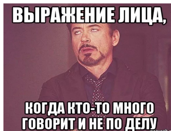
Рис. 1. Мем для объяснения максимы количества

ванные учениками, будут отражать базовые принципы общения, сформулированные Г. Грайсом и Дж. Личем. Например, мемы, представленные на рисунках 1, 2, позволят ученикам задуматься о правилах, составляющих максимы принципа кооперации.