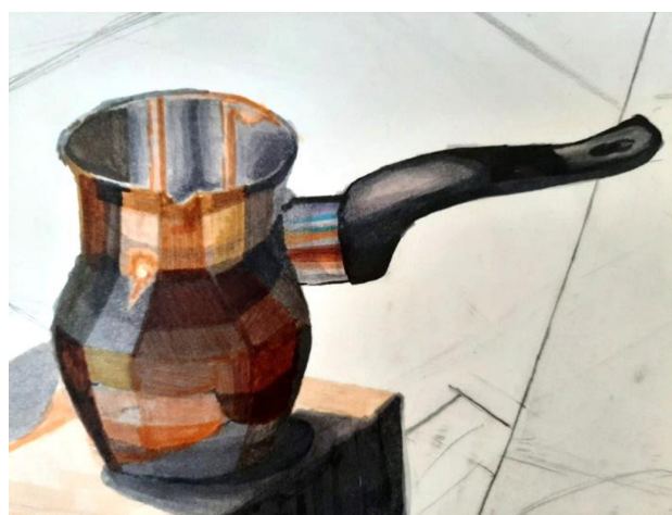
Рис. 2. Пример выполнения лессировки маркерами