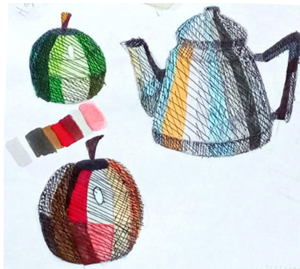
Рис. 1. Пример работы с эскизом

процесс [5, с. 66]; 6) передача светотеневых отношений предметов с помощью разных маркеров по цвету и тону.