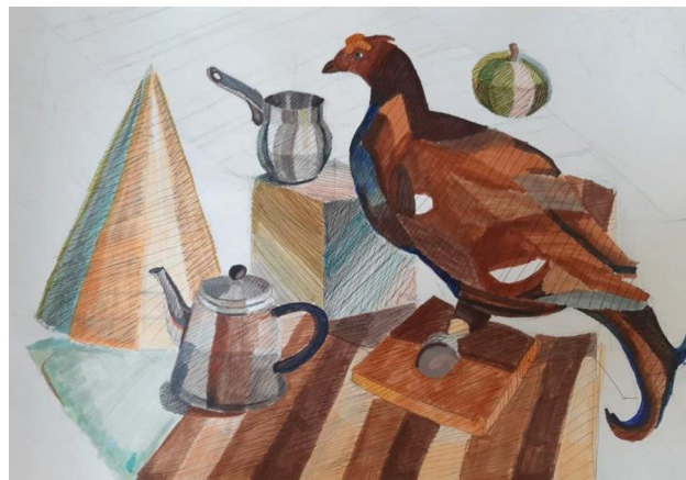
Рис. 3. Процесс работы в смешанной технике

рисунка и живописи. Формируются такие навыки, как передача объема и формы, изображение правильной конструкции предметов, передача материальности, фактуры с выявлением планов, на которых они расположены; навыки самостоятельно применять различные художественные материалы (маркер, линер, гелевая ручка) и приемы работы (рис. 4).