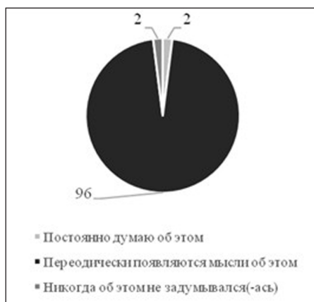
Рис. 1. Результаты диагностики осознанности студентами роли высшего образования в жизни человека, %

в удовлетворении познавательного интереса на ступени начального «погружения» в профессию (рис. 3).