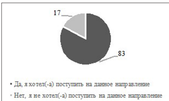
Рис. 2. Результаты выявления числа респондентов, заведомо планировавших поступить на факультет психологии и педагогики, %