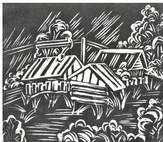
Рис. 2. Пейзаж с применением штриха как основного выразительного средства