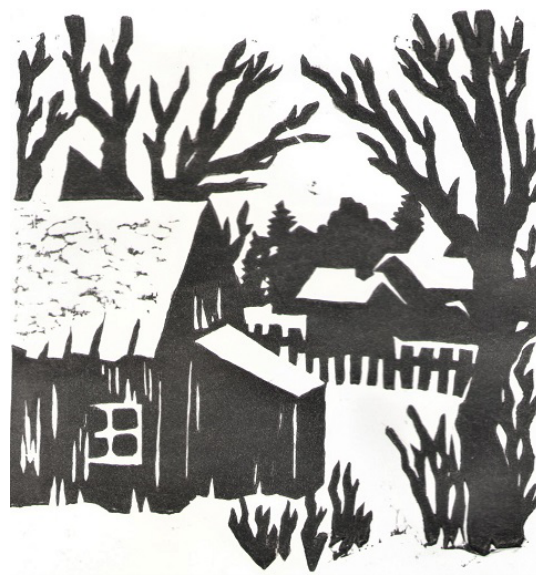
Рис. 4. Пейзаж с применением силуэта как основного выразительного средства

печатью черно-белой линогравюры: обучающиеся могут проявить собственную творческую инициативу и отпечатать гравюру цветными красками или на тонированной бумаге различных оттенков [1; 2].