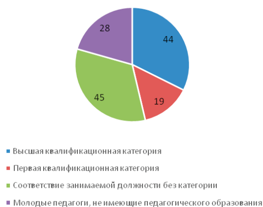
Рис. 2. Квалификация педагогических работников колледжа