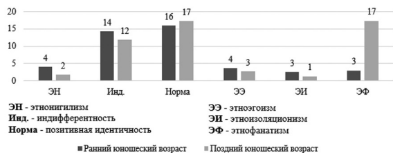
Рис. 1. Выраженность видов этнической идентичности личности в раннем и позднем юношеских возрастах

Для изучения степени выраженности различных видов этнической идентичности обратимся к рисунку 1, на котором можно заметить динамику в проявлении того или иного вида. Так, выраженность позитивной этнической идентичности увеличивается от возраста к возрасту. Также стоит отметить положительные сдвиги в уменьшении таких деструктивных видов, как эгоизм и изоляционизм. Высокий уровень индифферентности является естественным для этнической идентичности в рамках глобализации.