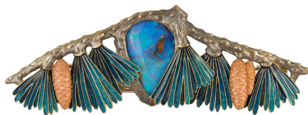
Рис. 2. Ильгиз Ф. В вечернем сосновом лесу. Брошь. Золото, опал, горячая ювелирная эмаль. 2010 г.