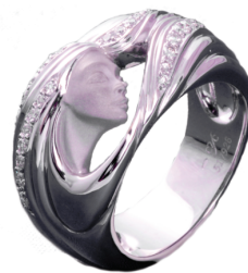
Рис. 1. Carrera y Carrera. Кольцо Eden. Белое золото, бриллианты. Коллекция создана в 1978 г.