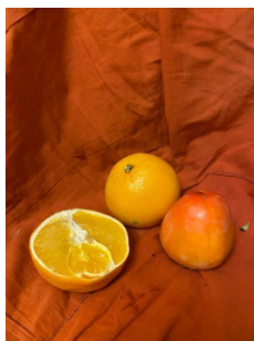
Рис. 1. Натюрная постановка

И зучение основ цветоведения в художественной школе помогает детям познавать окружающий мир, учит наблюдательности. На занятиях живописью учащиеся учатся анализировать цвет предметов, а также правильно смешивать цвета и многому другому. Одну из учебных проблем составляет изучение теплых и холодных оттенков одного и того же цвета. Учащимся достаточно трудно определить, где теплые, а где холодные оттенки цвета. Для изучения этой учебной проблемы был поставлен натюрморт из трех предметов (рис. 1).