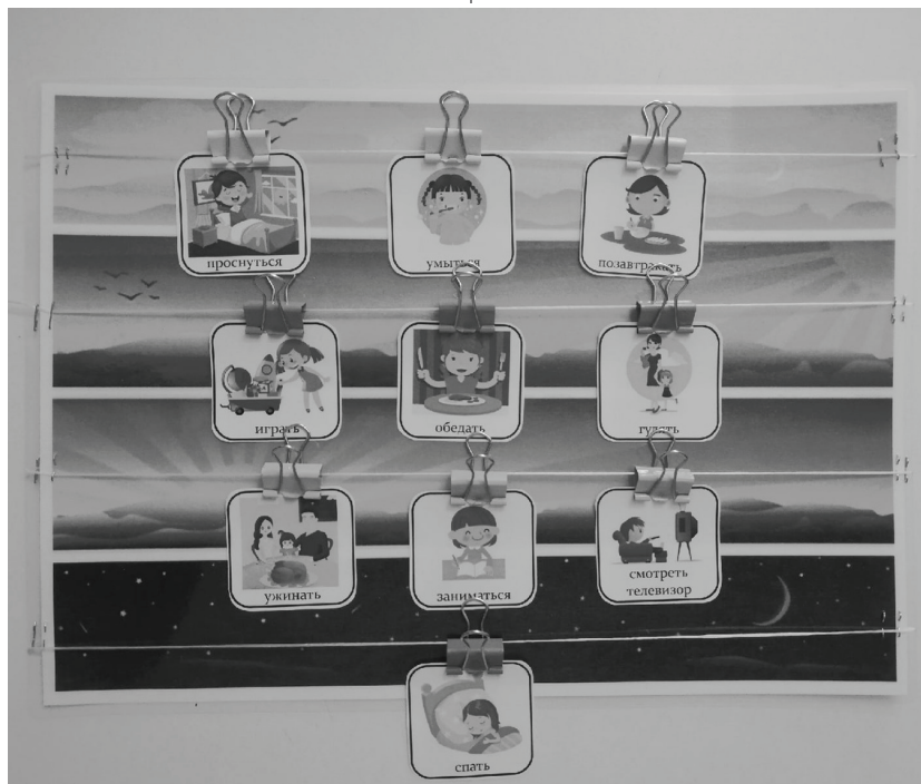
Рис. 2. Суточная карта

Правильное распределение карточек (в нашем случае) выглядит следующим образом (см. рис. 2.):