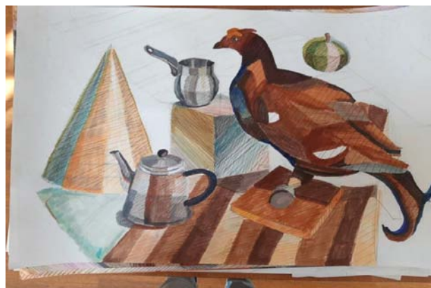
Рис. 3. Процесс работы в смешанной технике

рисунка и живописи. Формируются такие навыки, как передача объема и формы, изображение правильной конструкции предметов, передача материальности, фактуры с выявлением планов, на которых они расположены; навыки самостоятельно применять различные художественные материалы (маркер, линер, гелевая ручка) и приемы работы (рис. 4).