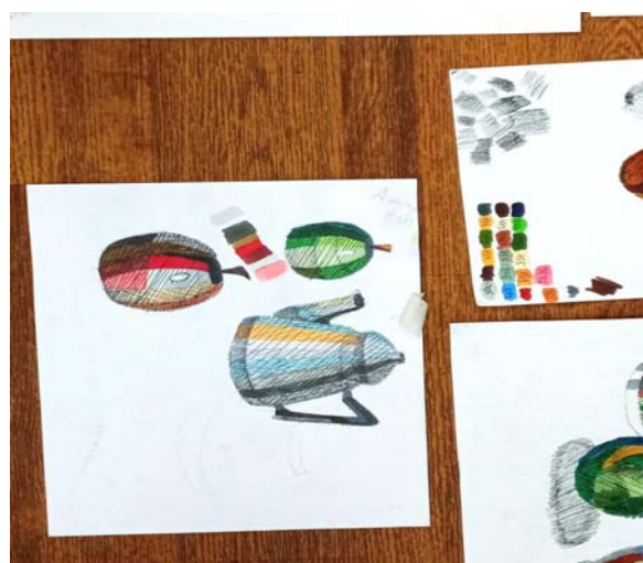
Рис. 1. Пример работы с эскизом

процесс [5, с. 66]; 6) передача светотеневых отношений предметов с помощью разных маркеров по цвету и тону.