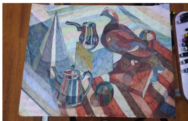
Рис. 4. Пример выполнения итоговой работы в смешанной технике

Наложение цветных слоев выполняется по принципу «от светлого к темному». Наиболее светлые оттенки каждого цвета прокладываются в первую очередь. Затем в теневых частях их можно перекрывать более насыщенными и темными цветами. При этом работу нужно начинать с наиболее крупных цветовых пятен постановки, имеющих значение для общего цветового строя произведения, постепенно переходя к более мелким частям каждого предмета, т. е. вести работу от общего к частному.