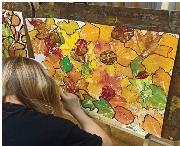
Рис. 3. Процесс работы над монотипией

Кляксография — это техника рисования кляксами, пятнами, разводами, каплями. При получении различных клякс ребята находят в расплывчатых изображениях какие-либо ассоциативные образы и дополняют их деталями. В работе используются такие материалы и инструменты, как акварель, трубочки, нитки, ватные палочки (рис. 2). При выполнении отпечатков у учащихся развивается глазомер и координация рук, воображение и творческое видение, отрабатываются навыки работы с красками и кистям, развиваются старательность, аккуратность, внимательность. Для изучения монотипии в 1-м классе предлагается выполнить задание с помощью отпечатывания осенних листьев (рис. 3). Учащиеся прокрашивают листья со стороны, где располагаются прожилки, делают отпечатки. Рассмотрим монотипию для учащихся