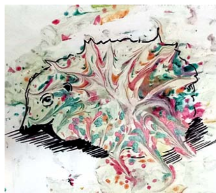
Рис. 1. «Волшебный ёж», К. Верина, акваграфия

Акваграфия — это нанесение изображения на лист бумаги с помощью прикладывания бумаги к воде, на поверхности которой находится пленка краски. Отпечаток дополняется, дорабатывается линиями для получения точного изображения. В данной монотипии можно использовать не только акварель, но и лак, молоко, кисель (рис. 1). Работа развивает воображение, формирует творческий потенциал, пробуждает интерес к рисованию, вызывает у учащихся положительные эмоции.