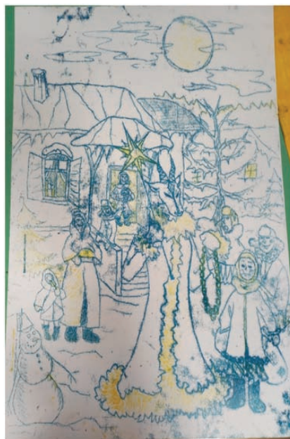
Рис. 5. Диатипия. Второго слоя. «Рождество», Евгения В., 12 лет, бумага, типографская краска