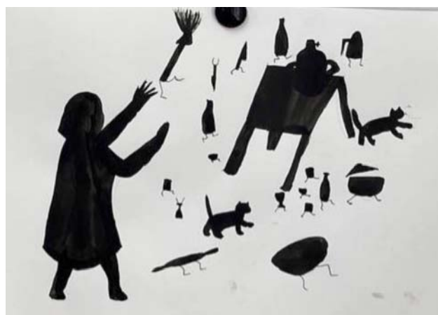
Рис. 2. «Федорино горе», Саша П., 12 лет, бумага, гуашь