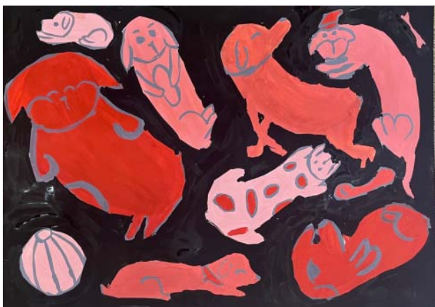
Рис. 6. «Веселые собачки», Маша И., 12 лет, бумага, гуашь