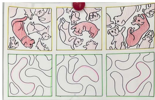
Рис. 5. Наглядное пособие

Следующий этап — это выполнение работы в цвете. Важно подкреплять композиционный центр отдельными цветовыми деталями, чтобы всё внимание зрителя не было сосредоточено только на одной собачке. Например, главная собака красная, и на других собаках есть красные детали: ошейник, бантик, пятнышки на шкуре и др. (рис. 6, 7, 8).