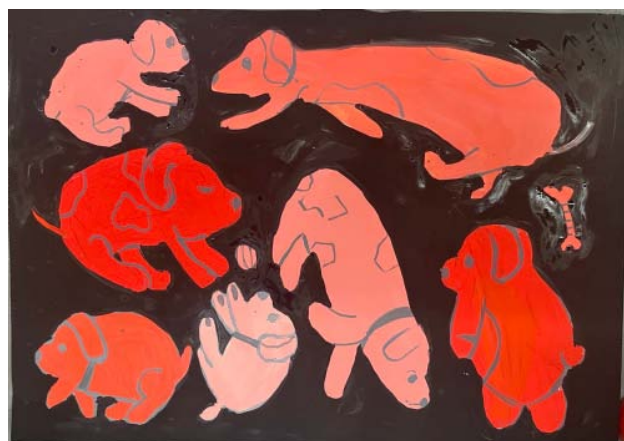
Рис. 7. «Веселые собачки», Саша П., 12 лет, бумага, гуашь