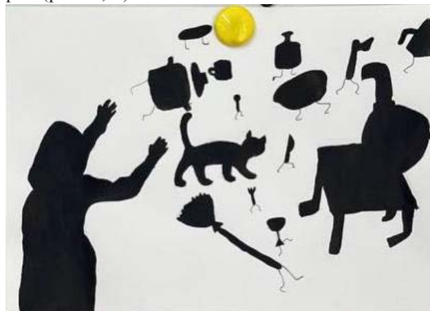
Рис. 1. «Федорино горе», Маша И., 12 лет, бумага, гуашь

право, воспринимается зрителем как более быстрое (рис. 1, 2).